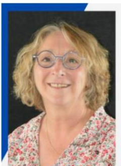
MME LOISEL Membre